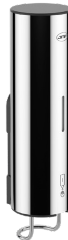
Polido / Polished / Pulido

T. (+351) 224 663 230 / F. (+351) 224 839 841 / e-mail - jnf@jnf.pt / www.jnf.pt