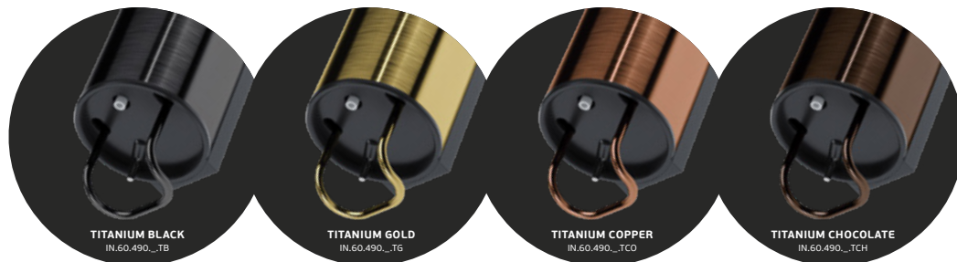
TITANIUM BLACK IN.60.490...TB