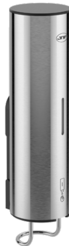
Satinado / Satin / Satin